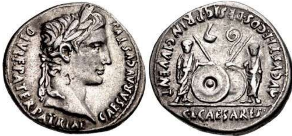
Tipiese voorbeeld van Antieke Romeinse silwermunte met die keiser se afbeelding daarop https://www.ngccoin.com/news/article/6842/NGC-ancient-coins/

Tiatira het egter oor die loop van tyd 'n naam verwerf vir sy vervaardigingsbedryf en klein industrieë. Ons weet byvoorbeeld dat Lydia, die purperverkoopster, ook oorspronklik van Tiatira gekom het. Daar was van alle soorte bedrywe in die stad – tekstielwerkers, skoenmakers, bronsmede, pottelbakkers en selfs slawehandelaars. Dit het ook beteken dat gildes of vakbonde 'n baie groot rol in die stad gespeel het. Die mag in Tiatira was nie in die hande van politici of selfs godsdiensleiers nie, maar in die hande van die gildes en handelaars. Die lewe in Tiatira het gedraai om handel en geld.