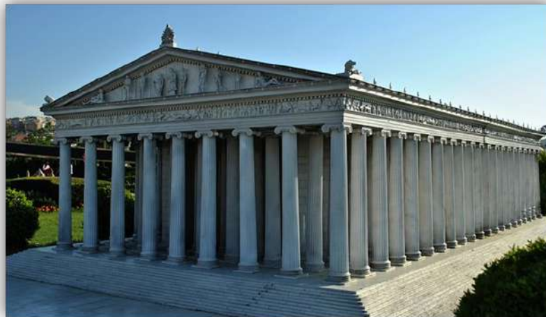
Tempel van Artemis in Efese: http://ephesusattractions.com/ephesus/around/temple-of-artemis

Vir die gemeentes aan wie die brief geskryf is, was dit baie belangrik om dit te weet. Ons hoor in die briewe ook van ander trone. Ons hoor dat daar in Pergamum 'n troon vir Satan is. Ons weet dat daar in al die stede allerhande tempels was met trone, onder andere ook trone vir die Romeinse keisers. Wat Johannes aan die gemeentes wou sê met hierdie prentjie was dat daar nog 'n troon is – wat uittroon bo die trone van die wêreld! Die Romeinse keiser is nie die Here nie: God alleen is die Here!