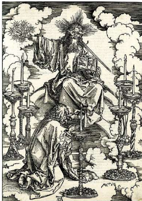
Houtgravure deur Albrecht Dürer (1471–1528): Johannes sien Christus tussen die sewe kandelare

Die laaste prentjie waarna ons gaan kyk, kry ons in Openbaring 1 waar ons lees dat die Gees Johannes "op die dag van die Here" meevoer na 'n plek waarvandaan hy die sewe gemeentes kon sien. Hy sien hulle gebrokenheid en twyfel, hulle sonde en dwaasheid, maar hy sien ook vir Christus agter en tussen die gemeentes staan. Christus beweeg tussen die sewe staanlampe. En dit maak al die verskil. Christus se plan is om van sy kerk, 'n koninkryk te maak wat wys hoe dit lyk waar Hy heers, en om van ons almal priesters te maak wat God ken en wat by die Here kan intree vir die wêreld (1:6). Omdat ons aan Christus behoort en sy Naam dra, omdat Hy agter ons staan en by ons is, begin ons verstaan dat gemeentes veel meer kan doen as wat mense dink moontlik is. As 'n mens die briewe lees en jy hoor wat die Here van sy sukkelende gemeentes verwag, wil jy soms wonder of iets hiervan kan kom. Maar dit is omdat Johannes weet wat Jesus kan doen en omdat hy die gemeentes sien in die kragveld van die Gees dat hy nie huiwer om veel te vra nie.