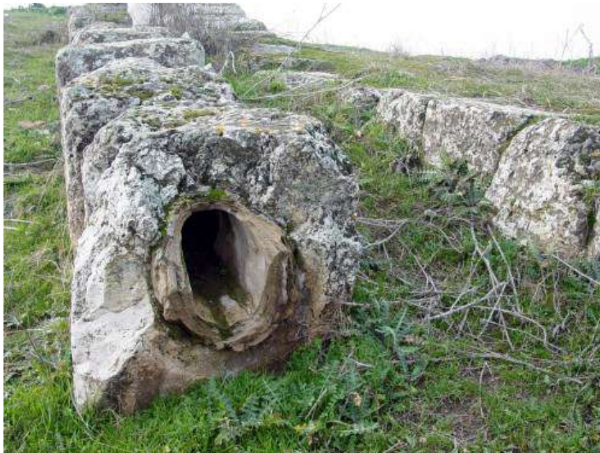
Oorblyfsels van die antieke waterpype buite Laodisea

Die stad het egter groot probleme met water gehad. Daar was nie goeie waterbronne nie en hulle was afhanklik van 'n bron sowat 10 kilometer buite die stad. Dit was egter 'n warmwaterbron en die probleem was dat teen die tyd dat die water in die stad aangekom het, dit nie meer warm was nie, maar lou.