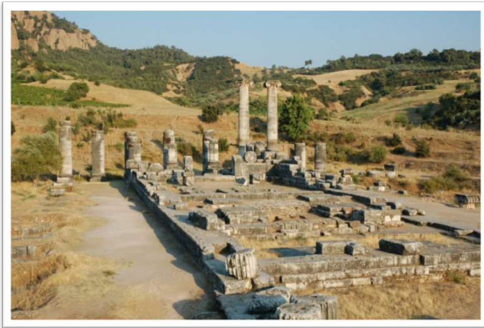
Die tempel in Sardis

Alles was nie so goed soos dit gelyk het nie. Ons hoor in vers 1 en 2 dat die Here vir die gemeente sê dat Hy weet van “alles” wat hulle gedoen het (en nie gedoen het nie!), en minder beïndruk was. “Julle het die naam dat julle lewe; maar ons, Ek en julle, weet dat julle eintlik dood is”, sê die Here. Maar dan kom die heel hardste woord as Jesus byvoeg: “wat julle doen vind ek nie goed genoeg voor die oë van my God nie” (vers 3). Iemand het geskryf dat die woorde “nie goed genoeg nie” herinner aan mense wat nie die toewyding gehad het om goed klaar te maak nie. Dit was op 'n manier die storie van die stad: agterlosigheid, luiheid, net nie genoeg omgee nie. Die duidelikste teken hiervan was die wonderlike tempel wat vir Artemis gebou is wat vir jare onklaar en half gebou gestaan het – as 'n teken van die mense se slapheid en luiheid. En nou wil dit lyk of die gemeente hierby aangesteek het. Die stad het nie soos die Christene geword nie; die Christene het soos die mense van die stad geword!