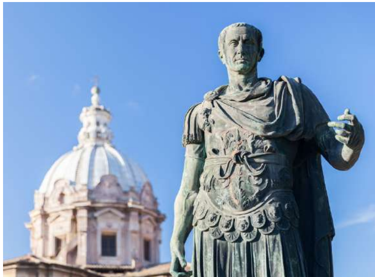
Julius Caesar, Romeinse keiser

Uit: https://www.britannica.com/biography/Julius-Caesar-Roman-ruler